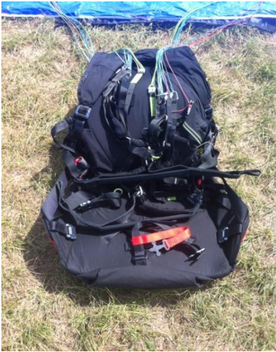
(1) Positionner les écarteurs au creux de la sellette