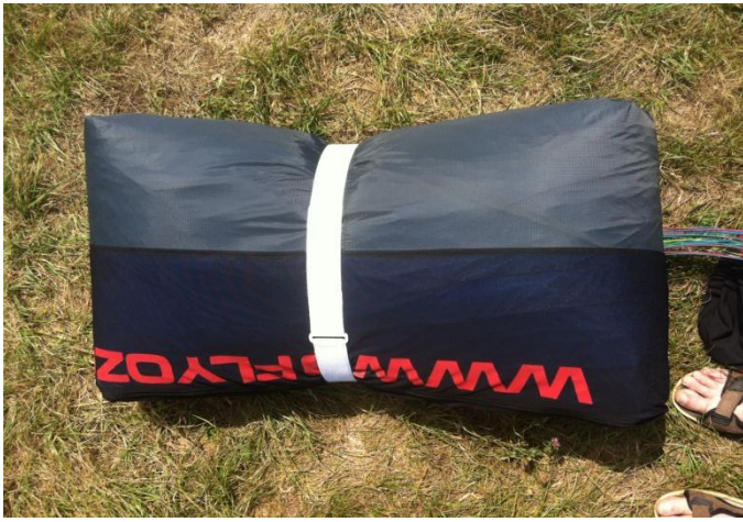
(10) Vue de l'ensemble plié