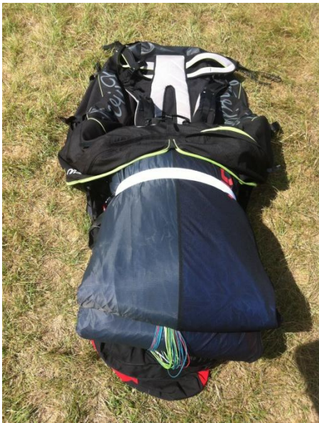
(12) Mise en sac