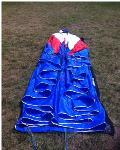
(5) Vue de la voile après avoir rassemblé le bord d'attaque