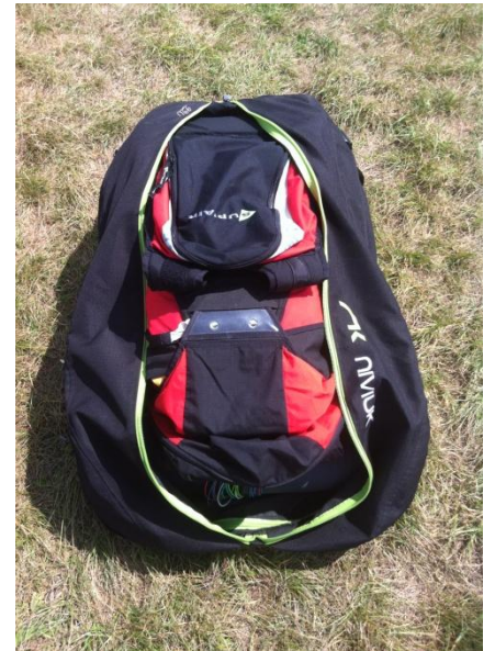
(14) Ajouter la sellette passager