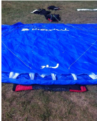
(2) Centrer la voile sur le saucisse bag