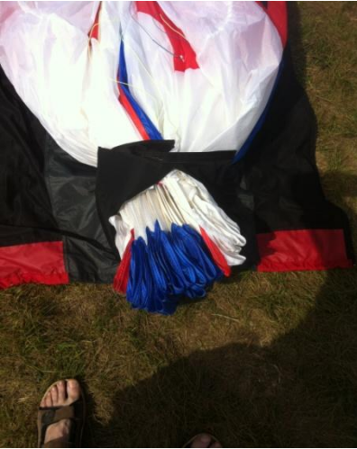
(4) Rassembler le bord d'attaque mylar contre mylar