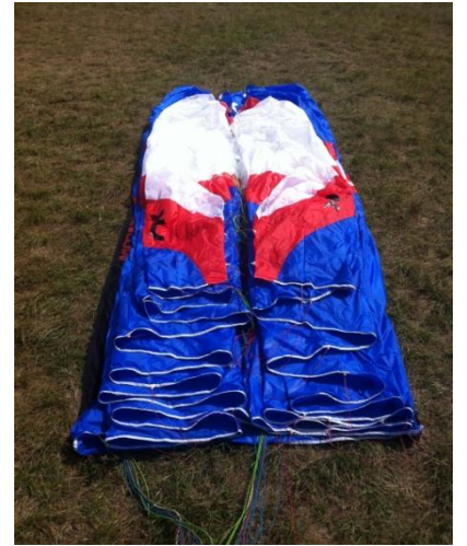
(3) Lover la voile