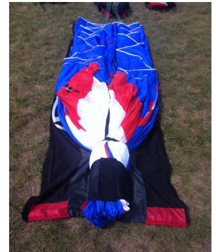
(6) Mettre le velcro et la sangle