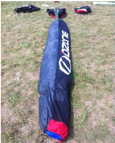
(7) Faire faire un quart de tour au saucisse bag (marquage ozone dessus)