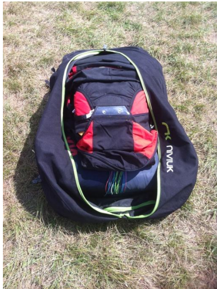
(13) Retourner l'ensemble