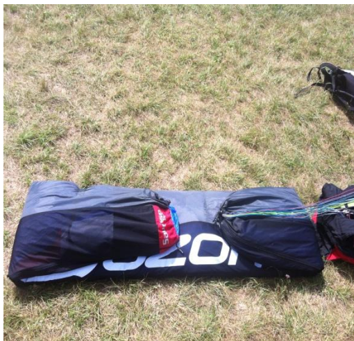
(8) Plier comme ci-dessus, puis en deux