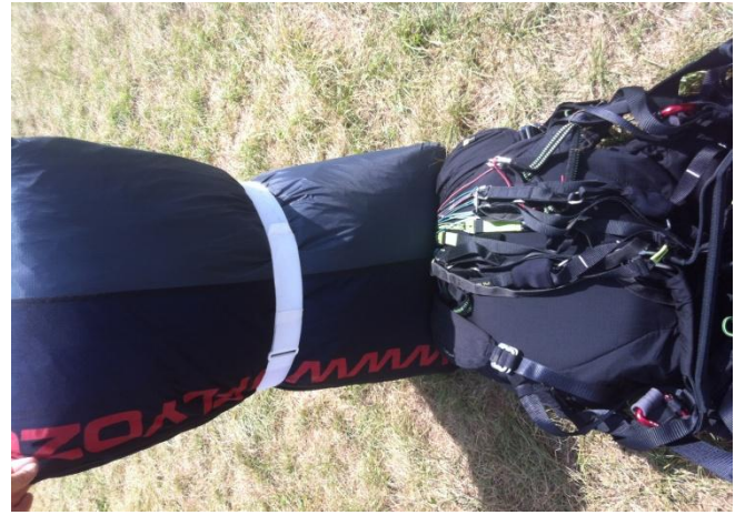
(11) Positionner le saucisse bag sur la sellette